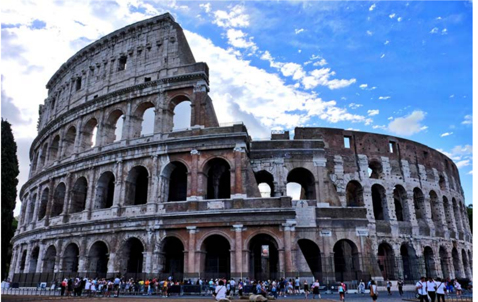
Coliseo de Roma Patrimonio de la Humanidad.