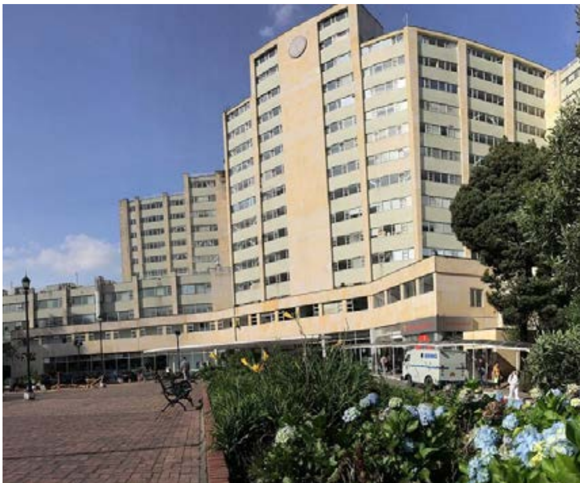
Hospital Militar Central

Desde la Casa de Nariño, la defensa es pragmática: el Ejecutivo sostiene que la facultad constitucional de libre nombramiento en entidades descentralizadas es legítima, especialmente cuando el objetivo es transformar la eficiencia del gasto y humanizar