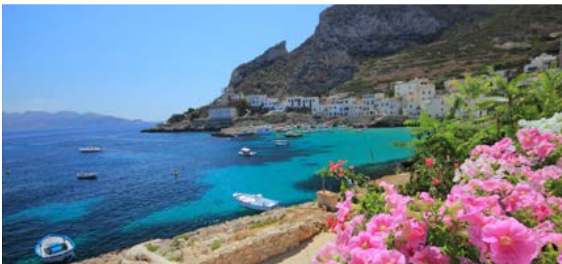
Isla Levanzo en Sicilia al sur de Italia.

cerca de la arena se hallaban mayor era el rango al que pertenecían.