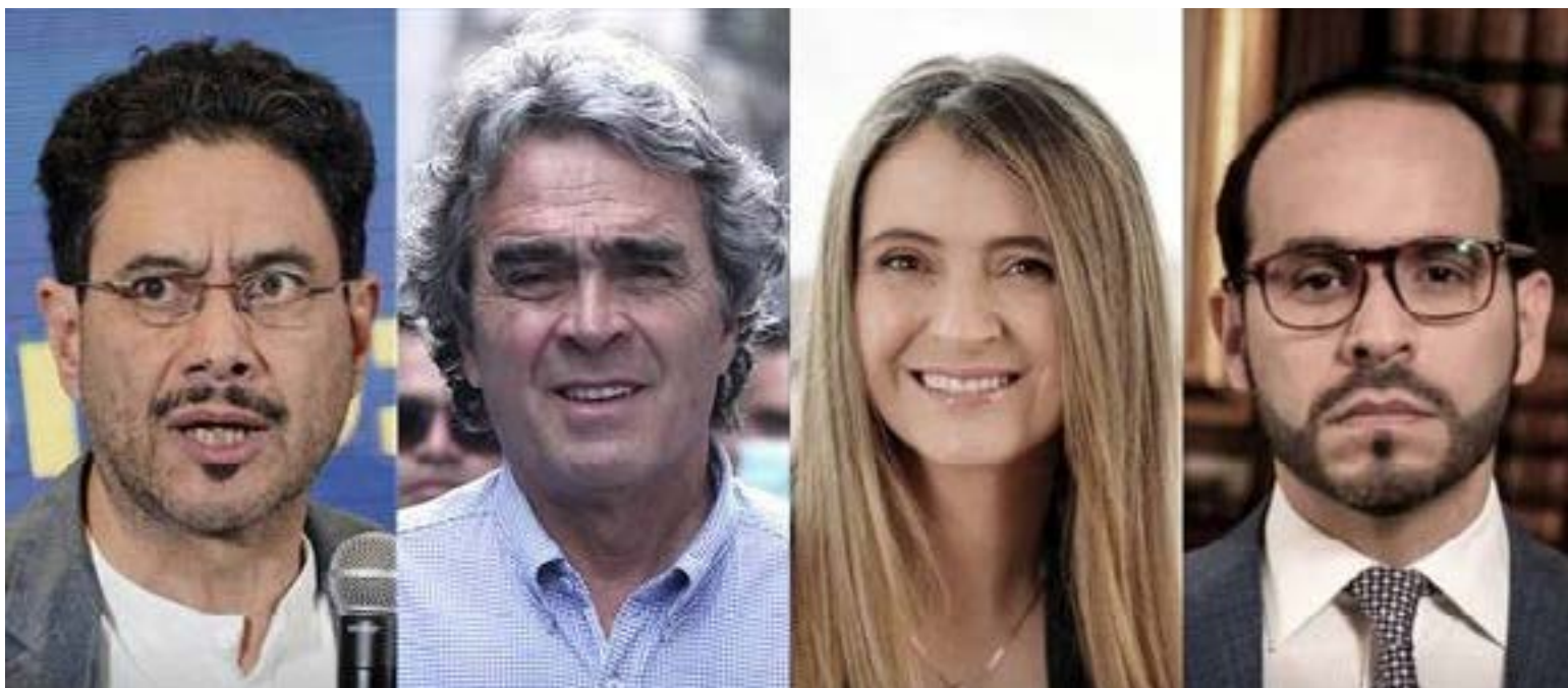
Cepeda, Fajardo, Paloma y Abelardo, son los candidatos que disputarán la presidencia de la República de Colombia.

I ván Cepeda se mantiene como el puntero sólido del sector con una intención de voto superior al 30%, aunque figuras como Daniel Quintero y Roy Barreras, que no alcanzan a registrar el margen de error de las encuestas mantienen pulsos internos por el liderazgo del progresismo en una primera vuelta que llegará fragmentada.