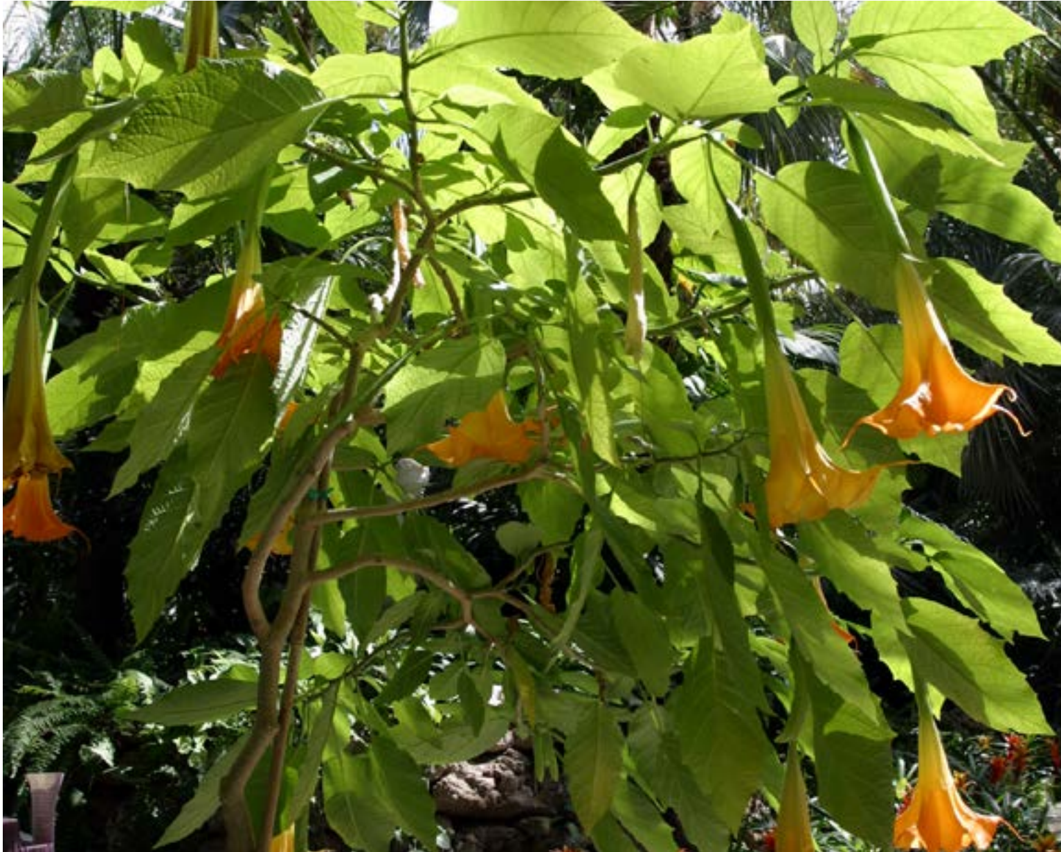
«Borrachero», planta del género Brugmansia nativa de Colombia, conocida por su capacidad para anular por completo la voluntad humana.