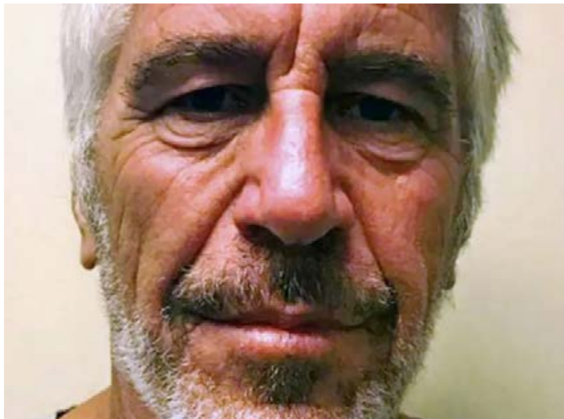
La desclasificación de los archivos de Jeffrey Epstein sigue revelando nexos sistemáticos con Colombia, desde su interés por plantas locales para anular la voluntad hasta menciones de figuras públicas en sus bitácoras de vuelo.

La desclasificación de los archivos que componen la denominada «Epstein Library» ha sacado a la luz una vertiente aterradora sobre los métodos de sometimiento empleados por el pederasta Jeffrey Epstein. Documentos recientes revelan que el financiero no solo conocía las propiedades de la escopolamina, sino que mantenía un interés sistemático en el «borrachero», planta del género Brugmansia nativa de Colombia, conocida por su capacidad para anular por completo la voluntad humana.