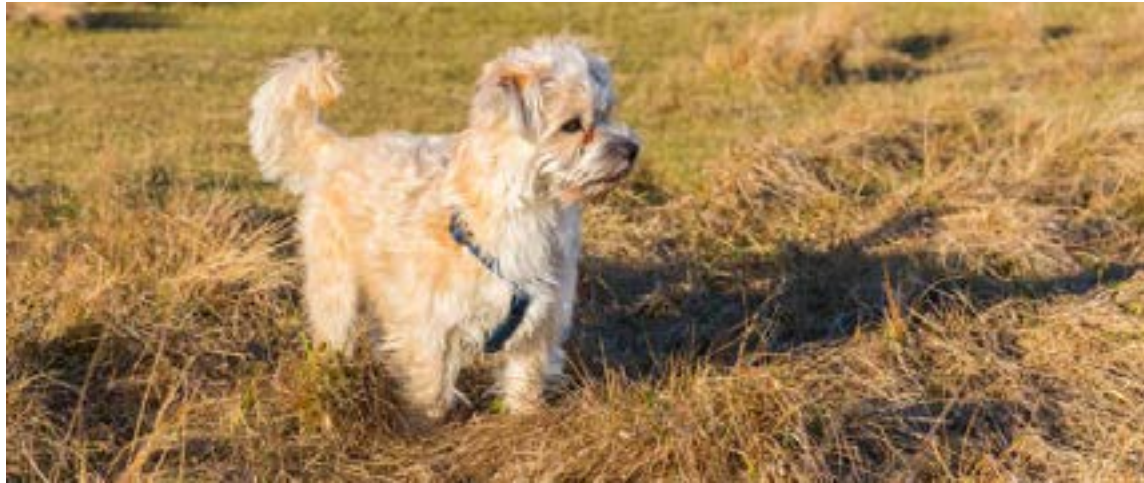
Perros ruba a Usa

A partir del 14 de julio del presente año entrarán en vigencia los nuevos requisitos temporales emitidos por los Centers for Disease Control and Prevention (CDC), para el ingreso de perros a los EE.UU, luego que hicieran una categorización de países con riesgo sanitario de rabia, en el que Colombia ha sido incluido.